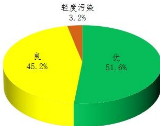
图 3 2023 年 7 月鄂州市区空气质量比例图