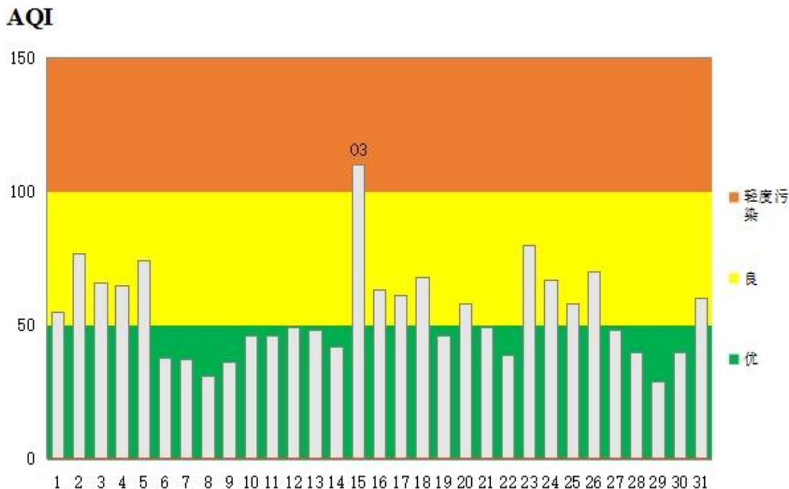
图 2 2023 年 7 月鄂州市区空气质量指数分布图

为可吸入颗粒物（PM 10 ）的天数 1 天。7 月份鄂州市城区空气质量指数（AQI）最大值 110（7 月 15 日），最小值 29（7 月 29 日）。7 月份市区环境空气质量指数和空气质量状况所占比例见图 2 和图 3。